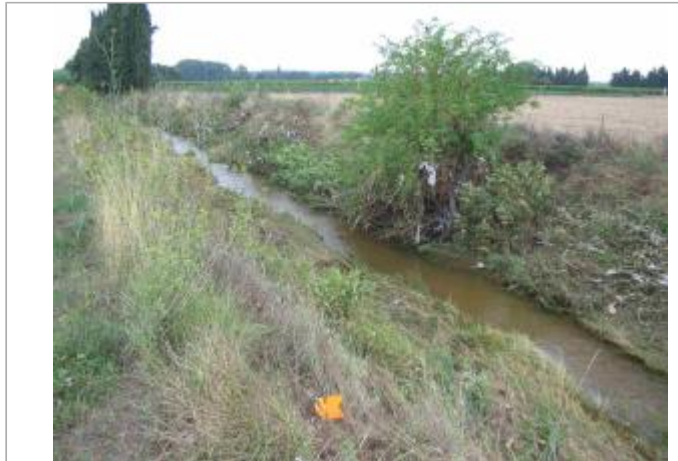
Vue du site - Auteur : Hydro Logik Ingénierie

Coordonnées WGS84 : X: 4.33194000 / Y: 43.79957100