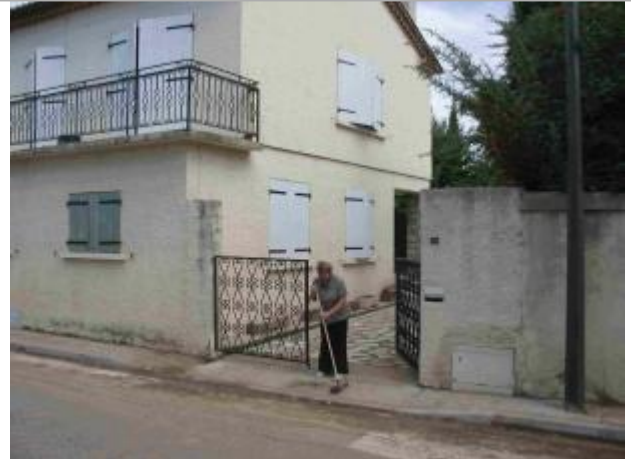
Vue du site - Auteur : Hydro Logik Ingénierie

Coordonnées WGS84 : X: 4.37975000 / Y: 43.79405200