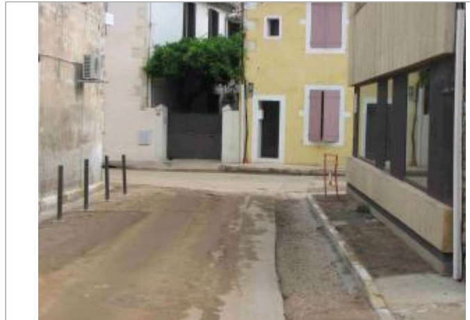
Vue du site - Auteur : Hydro Logik Ingénierie

Coordonnées WGS84 : X: 4.37844800 / Y: 43.79569000