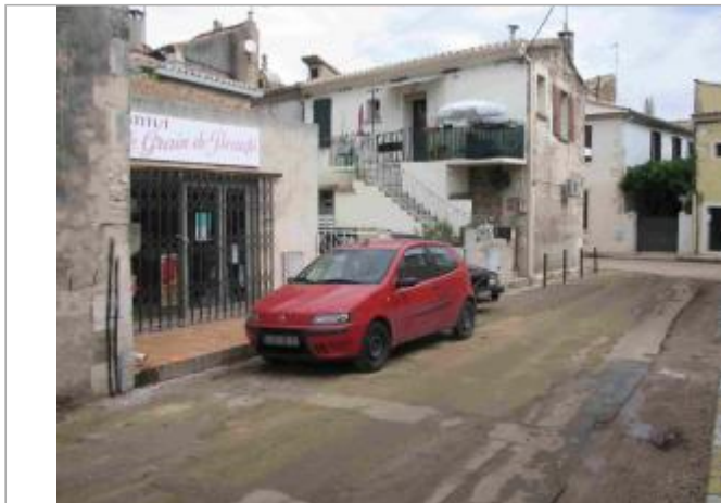
Vue du site - Auteur : Hydro Logik Ingénierie