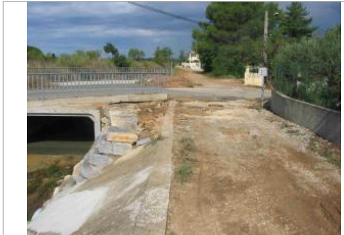
Vue du site - Auteur : Hydro Logik Ingénierie

Coordonnées WGS84 : X: 4.38237500 / Y: 43.78949100