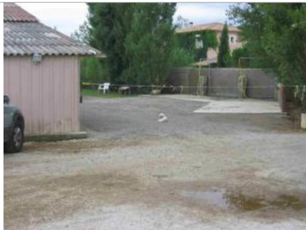
Vue du site - Auteur : Hydro Logik Ingénierie