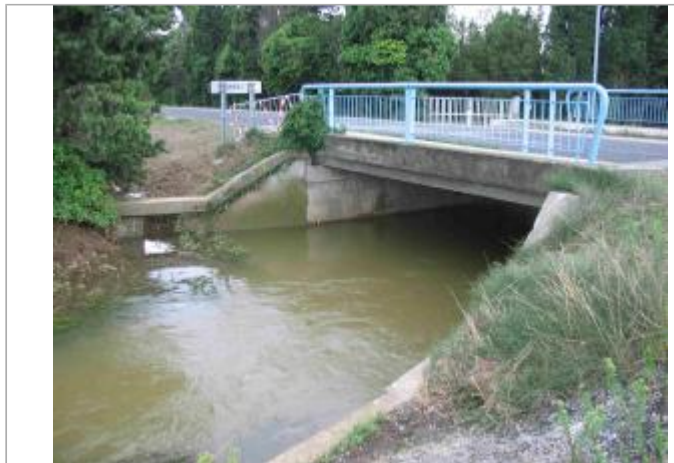
Vue du site - Auteur : Hydro Logik Ingénierie