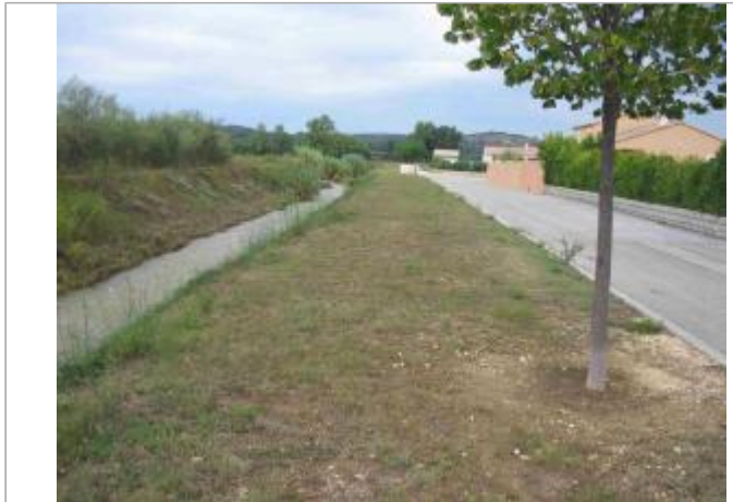
Vue du site - Auteur : Hydro Logik Ingénierie

Coordonnées WGS84 : X: 4.46106100 / Y: 43.87641000