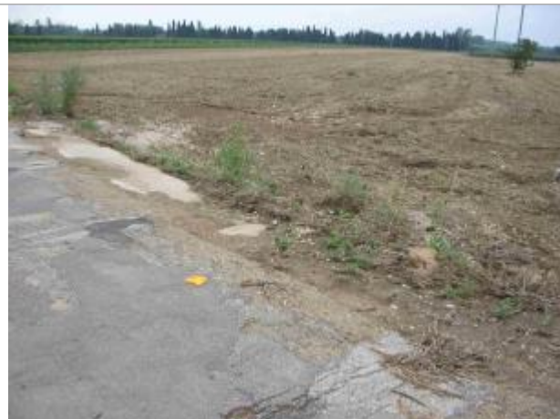
Vue du site - Auteur : Hydro Logik Ingénierie