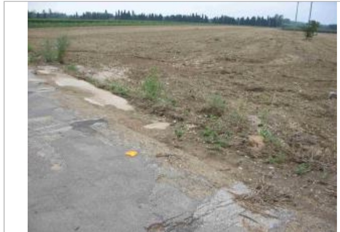
Vue du site - Auteur : Hydro Logik Ingénierie

Coordonnées WGS84 : X: 4.42527100 / Y: 43.85173200