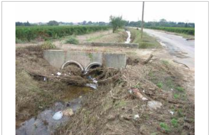
Vue du site - Auteur : Hydrologik Ingénierie

Coordonnées WGS84 : X: 4.42935200 / Y: 43.85165300