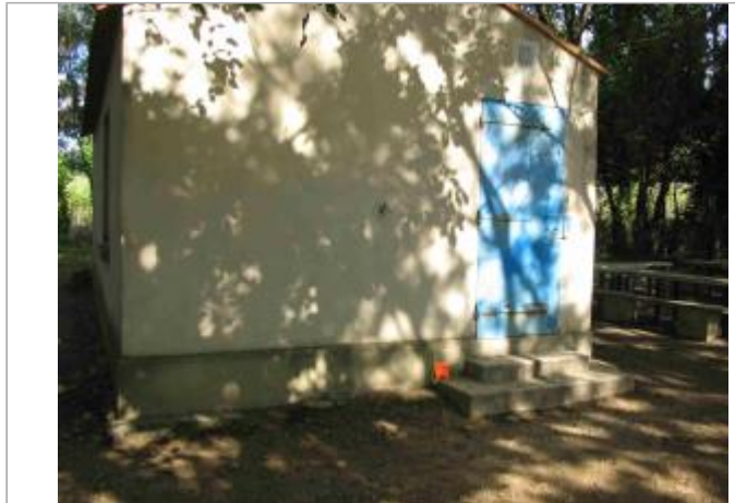
Vue du site - Auteur : Hydrologik Ingénierie

Coordonnées WGS84 : X: 4.25174700 / Y: 43.64334200