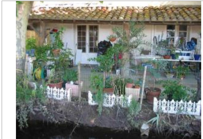
Vue du site - Auteur : Hydrologik Ingénierie

Coordonnées WGS84 : X: 4.22218400 / Y: 43.63120200