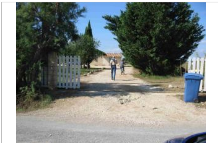
Vue du site - Auteur : Hydrologik Ingénierie