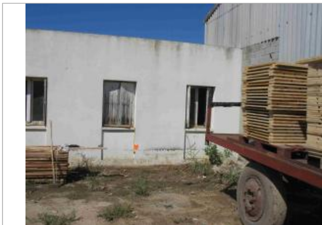
Vue du site - Auteur : Hydrologik Ingénierie

Coordonnées WGS84 : X: 4.27268400 / Y: 43.73275200