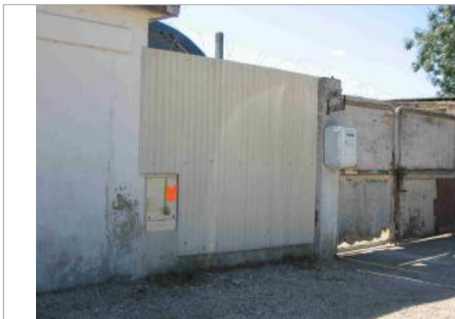
Vue du site - Auteur : Hydrologik Ingénierie