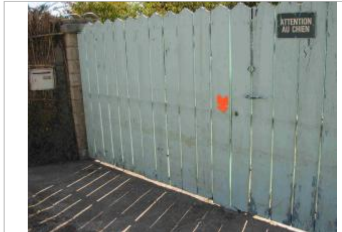
Vue du site - Auteur : Hydrologik Ingénierie

Coordonnées WGS84 : X: 4.27730300 / Y: 43.74561200