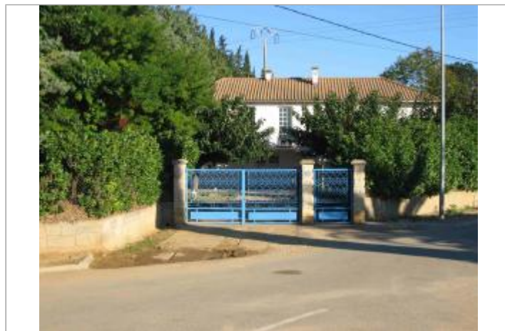
Vue du site - Auteur : Hydrologik Ingénierie

GÉOLOCALISATION Coordonnées WGS84 : X: 4.31632200 / Y: 43.75435700 Coordonnées RGF93 (Lambert 93) X: 806027.3 / Y: 6295920.97 Coordonnées RGF93 (ETRS89) : X: 4.316322 / Y: 43.754357 Code Hydro: Y35-0400 Rive de référence: Non renseigné