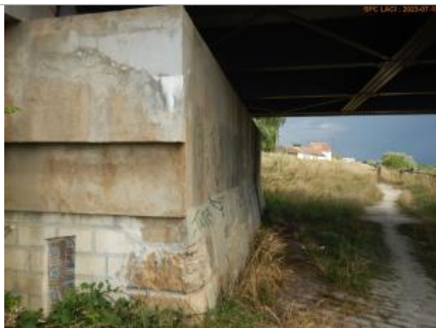
Vue du repère en 2023

Altitude calculée de l'eau (en m) : 169.615 m