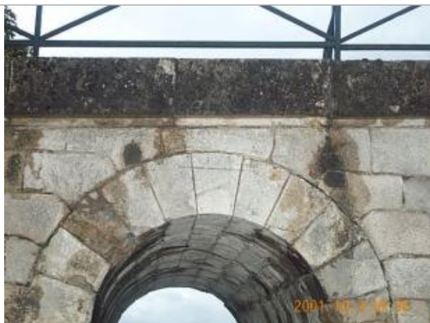
Vue du repère en 2001

Altitude calculée de l'eau (en m) : 135.385 m