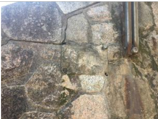
Vue en juillet 2018 (emplacement de la plaque)

Altitude calculée de l'eau (en m) : 271.0245 m