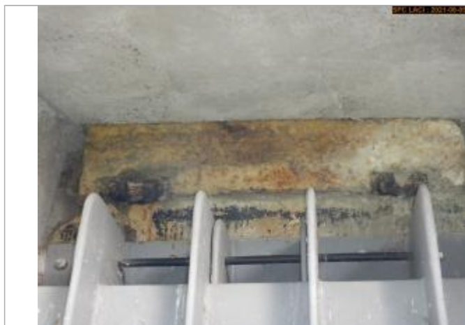
Vue du repère en 2021