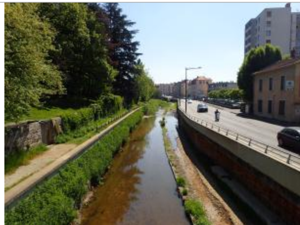
Vue d'ensemble boulevard Emile Zola