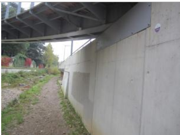
Repère de crue (2003)