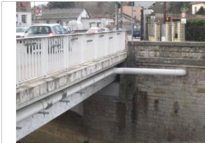
Vue d'ensemble pont Blanc