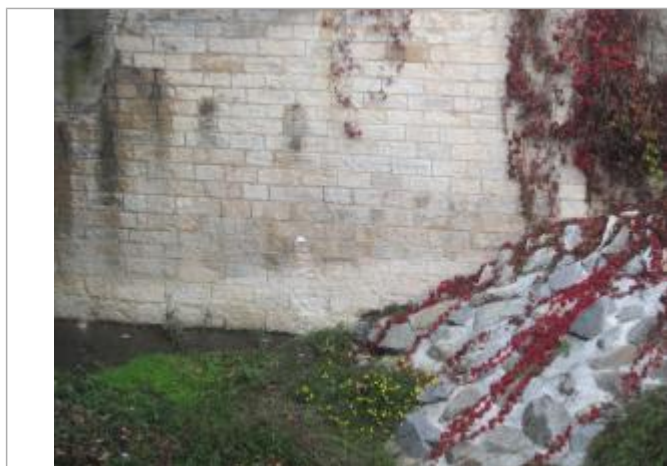
Repère de crue (2003)