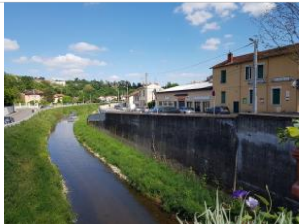
Vue d'ensemble boulevard de l'Yzeron