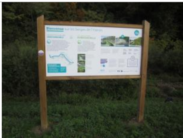
Repère de crue (2003)