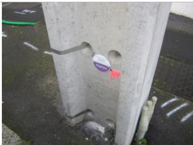
Repère de crue (2003)