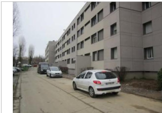
Vue d'ensemble avenue de Limburg