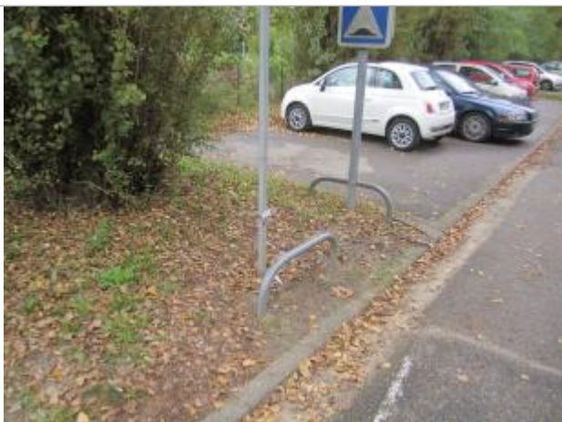
Repère de crue (2003)