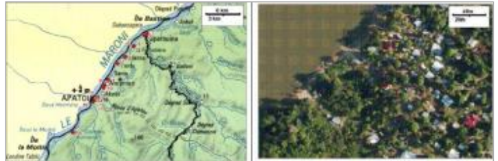
Localisation aérienne PHE n°6

Coordonnées WGS84 : X: -54.29278500 / Y: 5.23384900