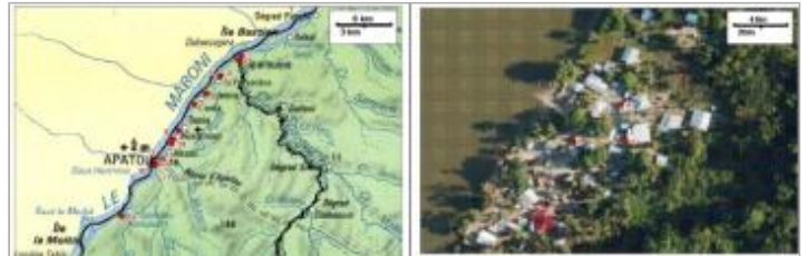
Localisation aérienne PHE n°5

Coordonnées WGS84 : X: -54.27846400 / Y: 5.25295590