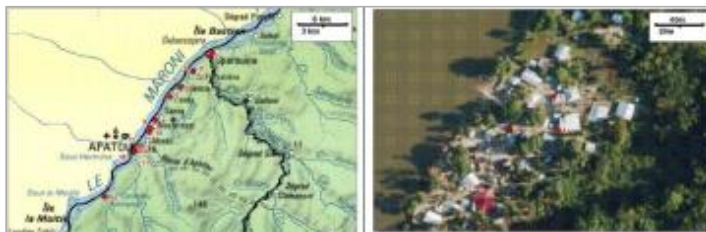
Carte + vue aérienne (point n°3)

Coordonnées WGS84 : X: -54.27812300 / Y: 5.25324800