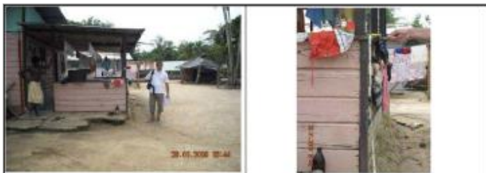
2 photos du repère