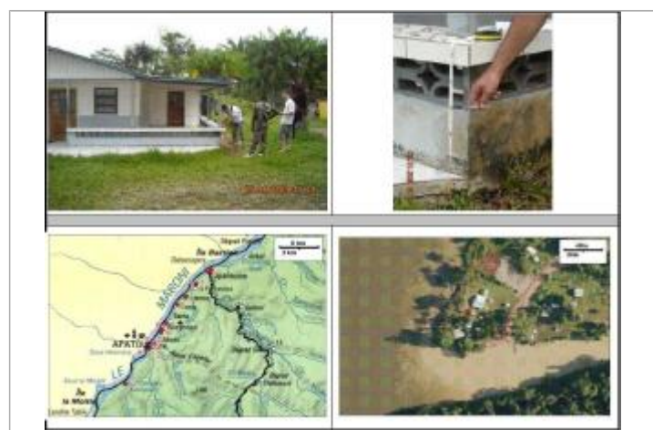
Muret devant terrasse maison blanche et bleue

MARQUE Maximum de l'inondation : Non renseigné Visibilité : Oui