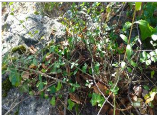
Localisation du repère