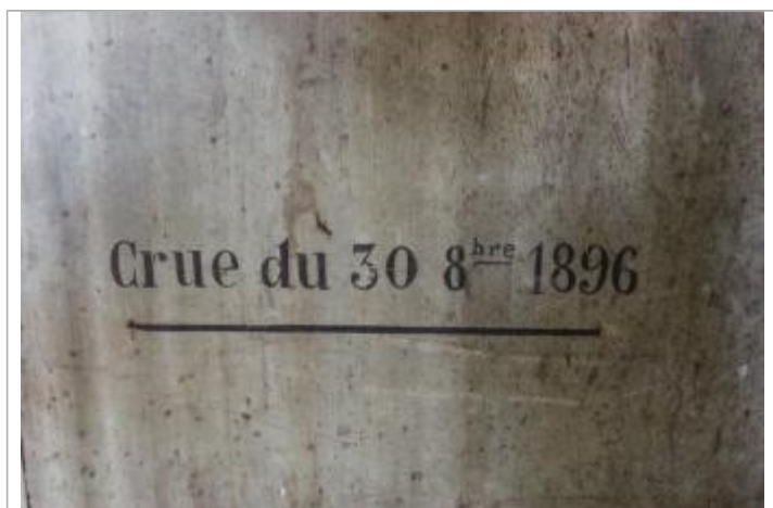
Marque crue 1896

Altitude calculée de l'eau (en m) : 55.131 m