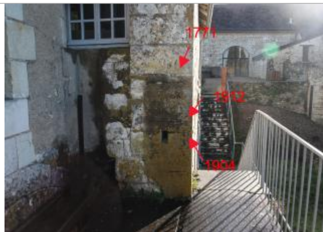
Mur pignon Ouest - face rivière