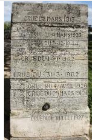
Borne à la Manu (1)