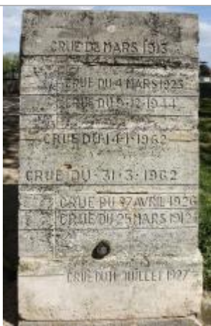
Borne à la Manu

Altitude calculée de l'eau (en m) : 50.439 m