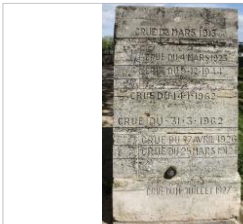
Borne à la Manu (1)

Coordonnées WGS84 : X: 0.53515700 / Y: 46.81211800