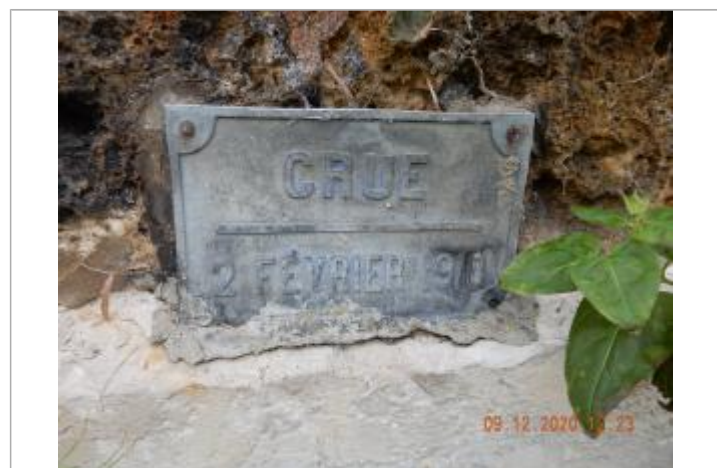
plaque crue 2 février 1910

GÉNÉRAL Code : IGN_R_C.B.L3 - 22-I Date de mise à jour : 10/12/2020 Auteur : IGN