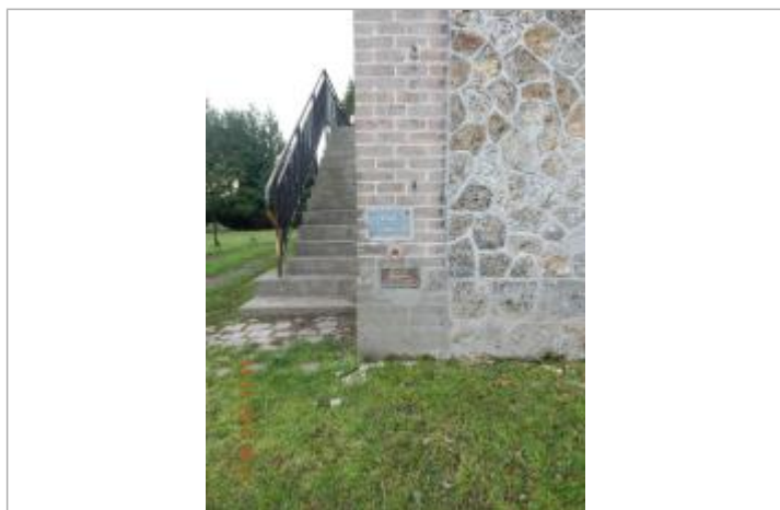
Repère de la crue de février 1945