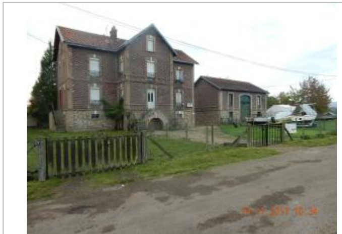
Maison éclusière