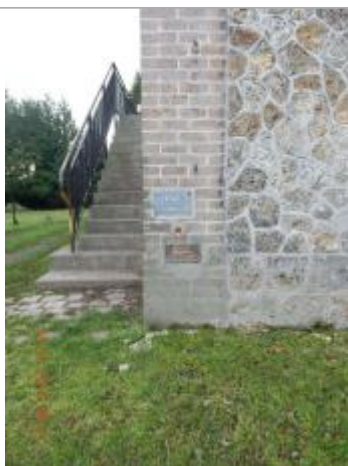
Repère de la crue du 2 février 1910