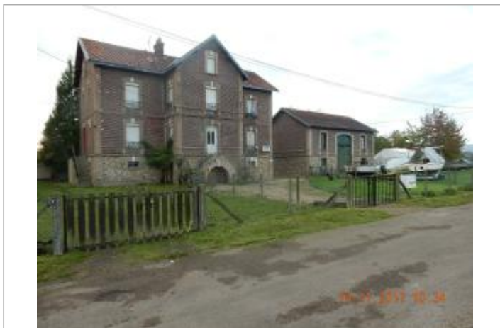
Maison éclusière