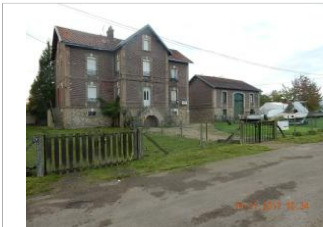
Maison éclusière

Coordonnées WGS84 : X: 1.03089700 / Y: 49.29607300