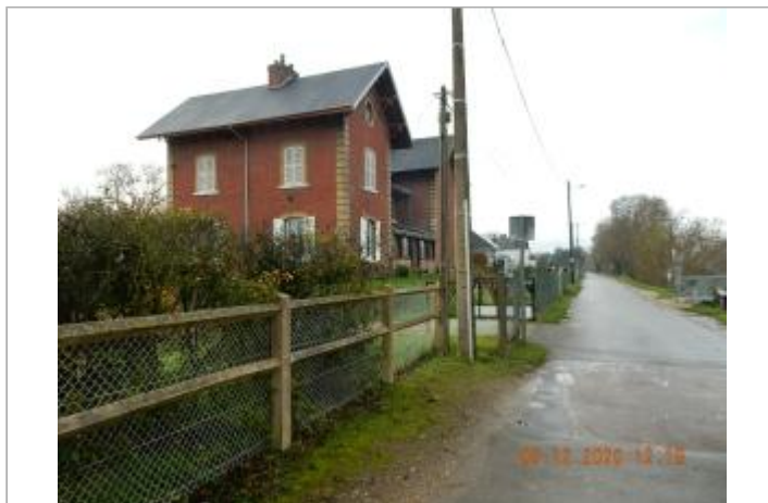
Rue du barrage