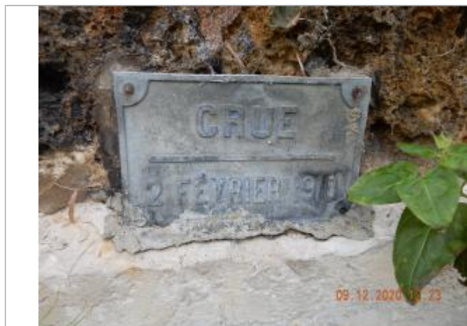
plaque crue 2 février 1910

Altitude calculée de l'eau (en m) : 8.118