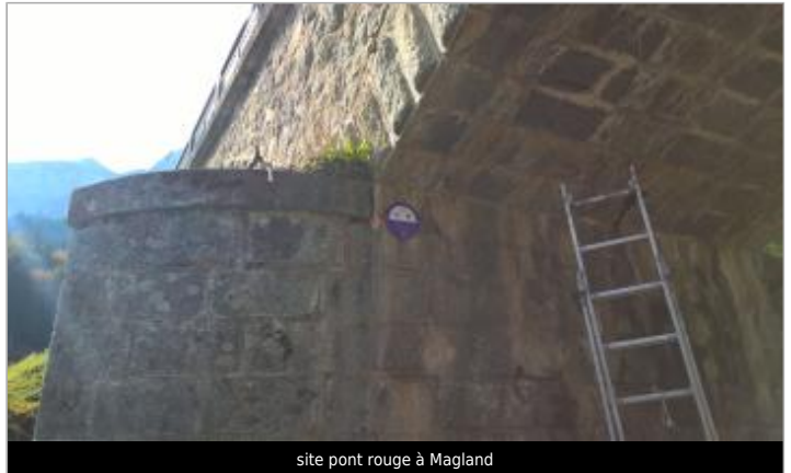
site pont rouge à Magland

GÉOLOCALISATION Coordonnées WGS84 : X: 6.61229860 / Y: 46.02401100 Coordonnées RGF93 (Lambert 93) X: 979347 / Y: 6553531.05 Coordonnées RGF93 (ETRS89) : X: 6.6122986 / Y: 46.024011 Code Hydro: V0--0200 Rive de référence: