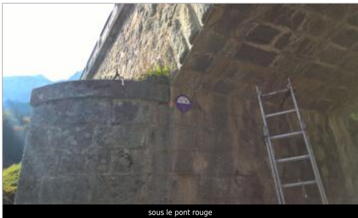
sous le pont rouge

MARQUE Texte : 1940 23 juillet, L'Arve Pérennité : Longue État du repère : Bon