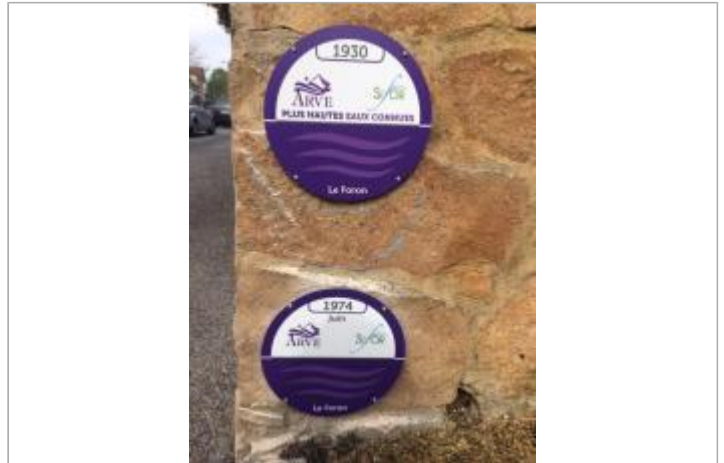
site repères de crues Ville la Grand