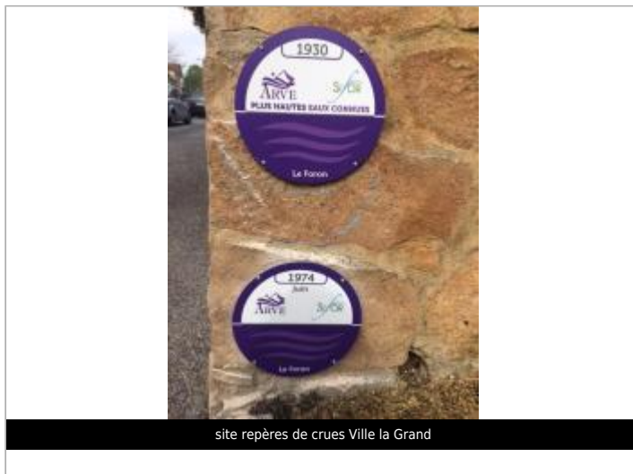
site repères de crues Ville la Grand

Coordonnées RGF93 (ETRS89) : X: 6.2471798 / Y: 46.203455