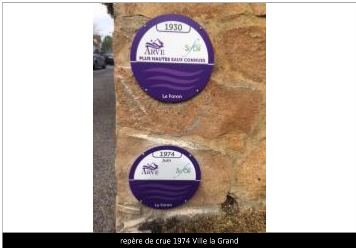
repère de crue 1974 Ville la Grand