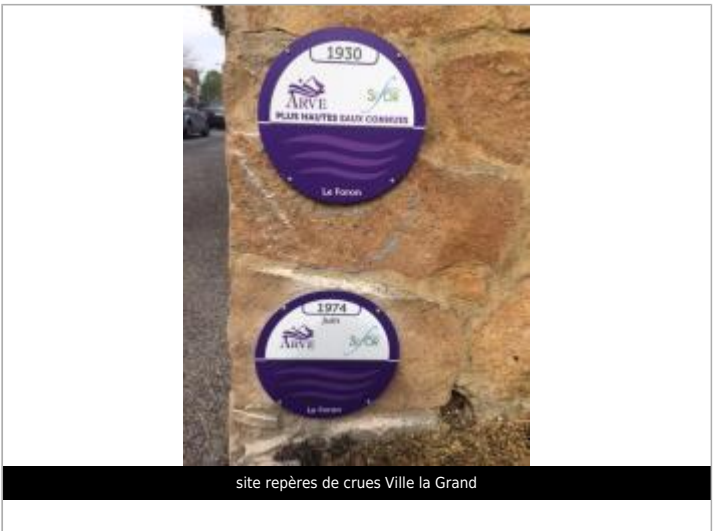
site repères de crues Ville la Grand