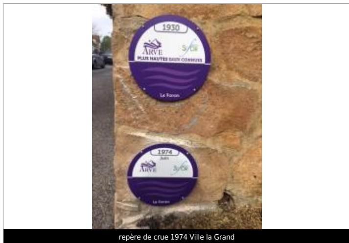
repère de crue 1974 Ville la Grand