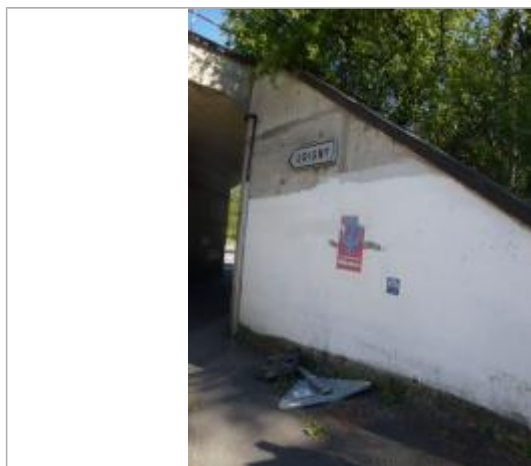
Repère de la crue de 2003 sur la façade du pont SNCF