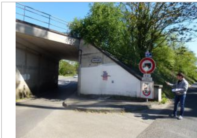
Repère de la crue de 2003 sur le façade du pont SNCF