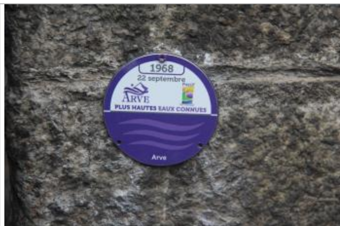
pont SNCF rue de la Jonction