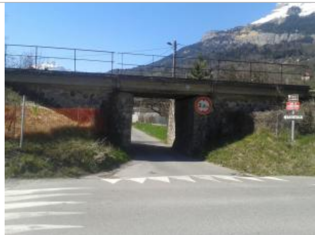
Site Pont SNCF rue de la Jonction à Passy