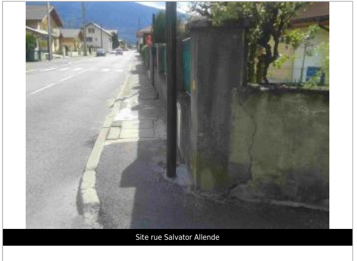
Site rue Salvador Allende