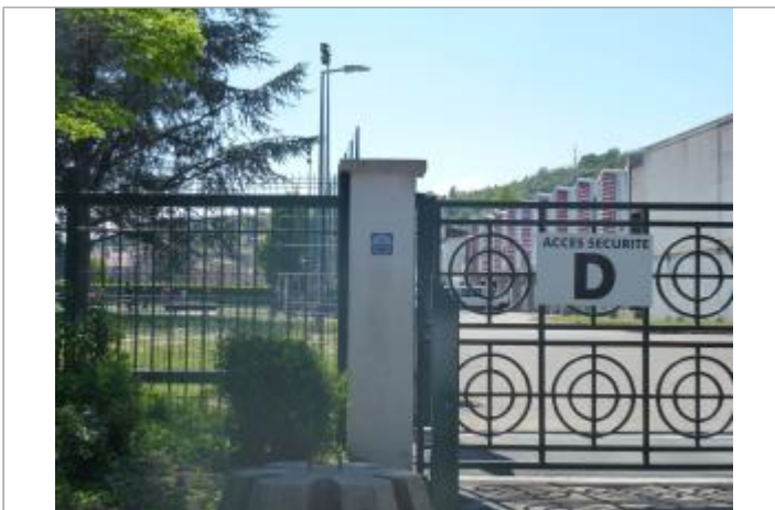
Repère de la crue de 2003 sur la pile du portail de l'entrée n°D