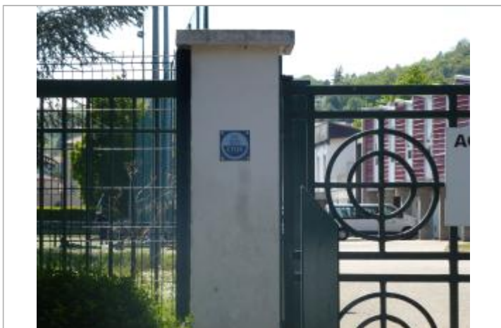
Repère de la crue de 2003 sur la pile du portail de l'entrée n°D

Texte : Crue du 2 décembre 2003 Maximum de l'inondation : Oui Visibilité : Oui État du repère : Bon Pérennité : Longue