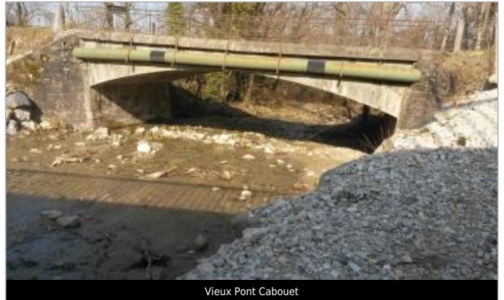
Vieux Pont Cabouet