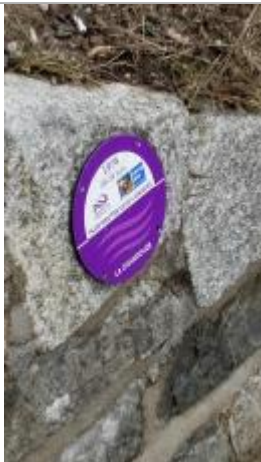
Crue du 28-29 juin 1974