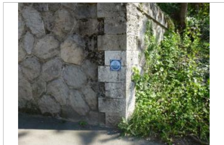
Repère de la crue de 2003 sur la pile du pont SNCF

MARQUE Texte : crue du 2 décembre 2003 Maximum de l'inondation : Oui Visibilité : Oui État du repère : Bon Pérennité : Longue