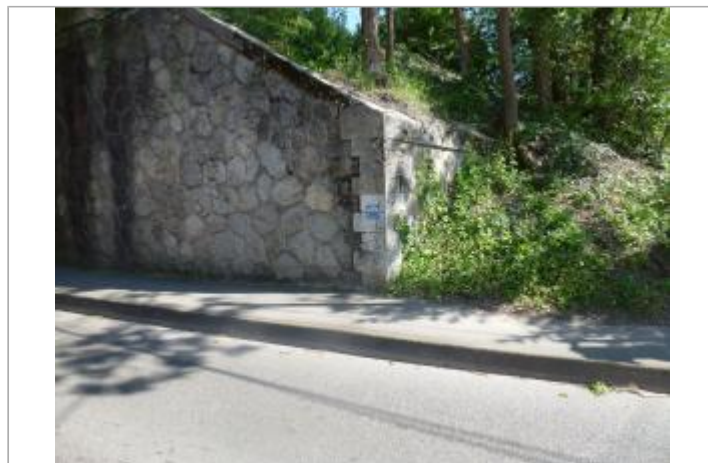
repère de la crue du 2 décembre 2003 sur la pile du pont SNCF

GÉOLOCALISATION Coordonnées WGS84 : X: 4.77524030 / Y: 45.60932500 Coordonnées RGF93 (Lambert 93) X: 838354.81 / Y: 6502644.4 Coordonnées RGF93 (ETRS89) : X: 4.7752403 / Y: 45.609325 Code Hydro: V3030500 Rive de référence: