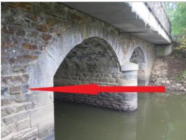
amont du pont sur la Valière

Altitude calculée de l'eau (en m) : 86.137 m