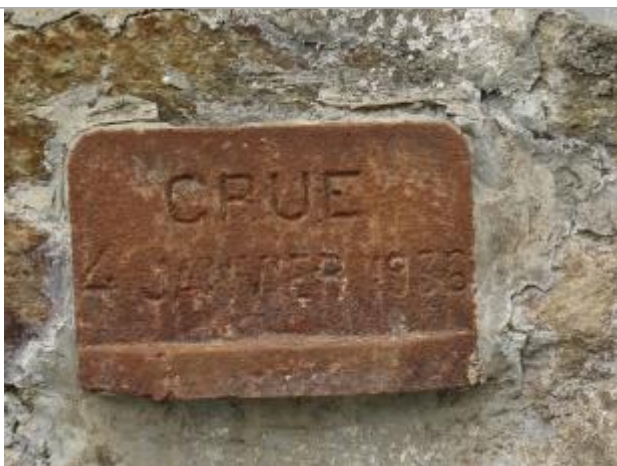
repère lors de la visite du SPC VCB le 17 octobre 2018

Altitude calculée de l'eau (en m) : 52.156 m