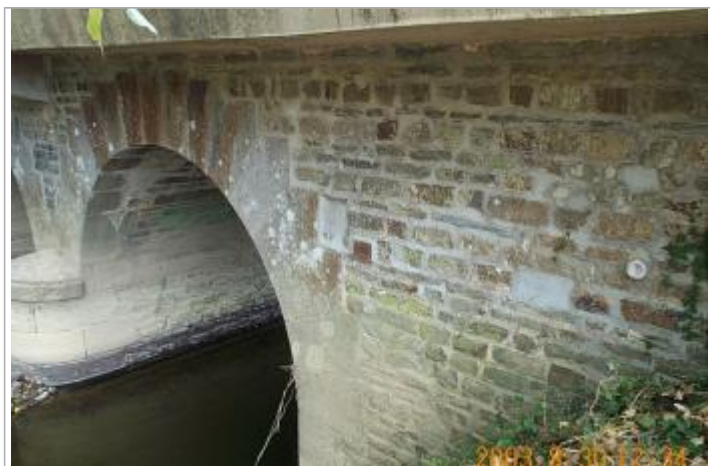
Photo des repères de crue et de nivellement IGN en 2003

SOURCE DE REPÉRAGE : RECENSEMENT DE REPÈRES DE CRUES ISSUS DE LA BASE DE DONNÉES GÉODÉSIQUE DE L'IGN - 27/02/2017