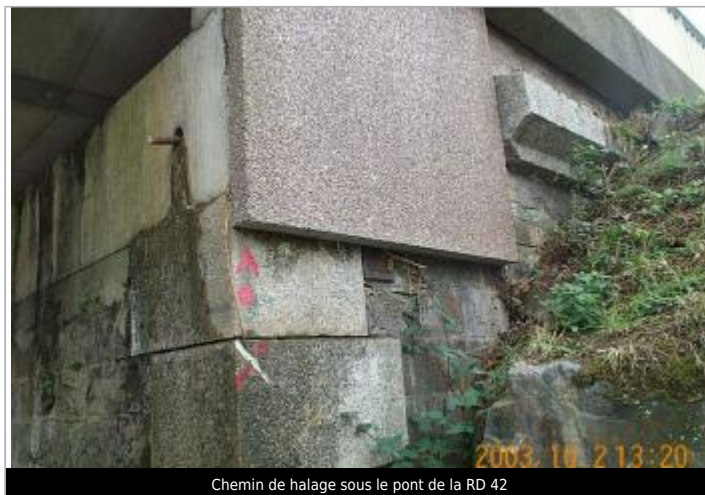
Chemin de halage sous le pont de la RD 42