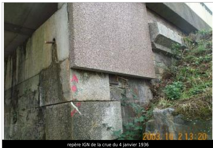
repère IGN de la crue du 4 janvier 1936

SOURCE DE REPÉRAGE : RECENSEMENT DE REPÈRES DE CRUES ISSUS DE LA BASE DE DONNÉES GÉODÉSIQUE DE L'IGN - 27/02/2017